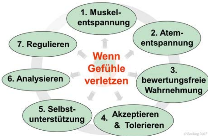
Abb. 2: Die sieben Basiskompetenzen zur Emotionsregulation (Berking 2010, S. 40)

Wenn die negativen Gedanken aufgrund der erregten Amygdala nicht unterbrochen werden können, landen